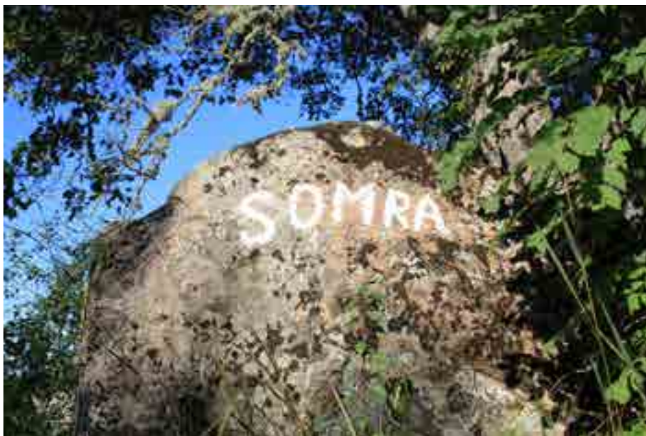
För många startar Marielund vid Somrastenen, vid Laggavägen strax söder om Funbo. Den vita texten skrevs dit på 1960-talet av Somras dåvarande ägare.

hade hyrt hus här innan de bestämde sig för att skaffa ett eget ställe. Några hus är byggda för att två familjer ska bo i dem, både husets ägare och en familj som hyr.