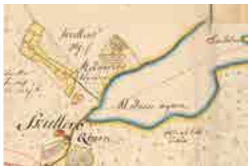
Mölnareviken enligt 1706 års karta. Skällero kvarn ligger vid utloppet på väg till Marielunds gård.

Sjön är bara ett par kilometer lång i vardera riktningen, men har förbindelse med sjöarna Ramsen och Norrsjön. En roddtur kan bli fyra kilometer som mest. Vatten från ytterligare två mindre sjöar, Byrsjön och Edasjön, rinner ut i Trehörningen. Det går inte att ta sig vidare per båt till Mälaren, men