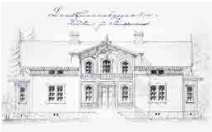
Utskjutande takpartier och rik dekorerade verandor är typiskt för schweizerstilen, det som ofta kallas snickarglädje. Bild ur en mönsterbok av C E Löfvénskiöld, 1868.

landsbygdens folk, och startade spelmansgillen för att främja folkmusiken. Carl Larssons bok Ett hem med akvareller från Carl och Karin Larssons hem kom ut 1899, och satte en helt ny standard för inredning. Mörka salonger med tunga sammetsgardiner byttes mot ljusa möbler med hembygdskänsla. Samma år kom Ellen Keys bok Skönhet för alla , där nya estetiska ideal presenterades. Runt sekelskiftet 1900 kom också influenser från den engelska Arts and Crafts-rörelsen.