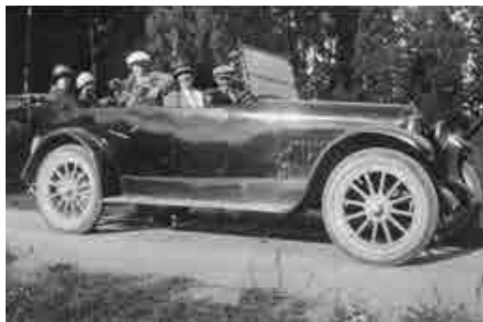
På 1920-talet reste man med tåg till Marielund. När gäster kom med bil till Breidagård en dag i augusti 1925 kom kameran fram.