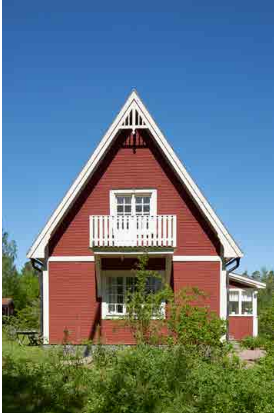
Rosentorp med sitt typiskt branta tak och dekoration vid nocken.

Arbetarbostaden hör till Marielunds gård. Intill denna plats stod Skällerö kvarn förr. Det var en större byggnad som fanns här till i början av 1900-talet. En äldre bod som hört till kvarnen står kvar på andra sidan bäcken.