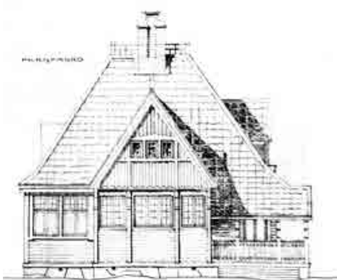
Arkitektens ritningar fungerade mer som en vägledning till byggmästaren som kunde arbeta med detaljerna efter eget huvud. Arkitektritning till Storudden 1906.