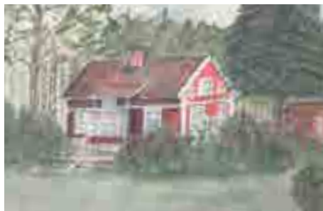
Huset Ryttdarb 2 revs på 1970-talet och ersattes av ett modernt hus. Akvarell av bokbindarmästare Thure Andersson.

är byggt antingen några år före eller efter det året. Marielunds gård ägde stället tidigare. På en karta från 1706 kallas platsen Swartvrjeten.