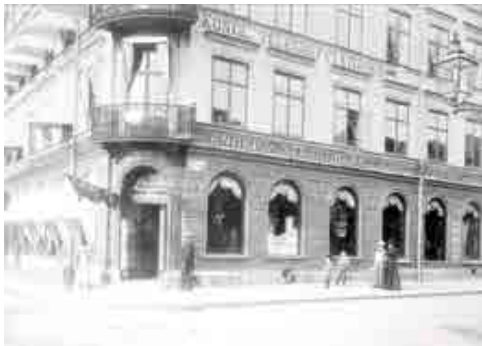
En grosshandlare sysslade med import och handel i större volymer och levererade till butiker som sålde till slutkunden. Ofta hade personer som kallades grosshandlare också annan verksamhet, som egna butiker och tillverkning. Foto från Strandbergs manufakturhandel cirka 1897, Upplandsmuseet.

Av de sommarhus som byggdes i början av 1900-talet i Marielund finns i stort sett alla kvar. Bara tre hus har försvunnit. Ett har brunnit ner, ett har drabbats av hussvamp och ett tredje har rivits för att ersättas av ett modernare hus. Några hus har byggts om eller renoverats så att den ursprungliga karaktären har förändrats. De allra flesta hus kan dock berätta historien om tiden när Marielund byggdes.