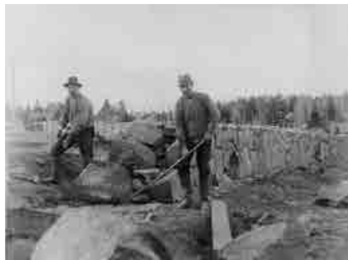
Det fanns gott om skickliga hantverkare och arbetare i trakten. Här byggs muren till Breidagård. Foto från stiftgårdens samling, cirka 1918.

Marielund liknar inte en bondby, där husen ligger tätt. Här ville man istället ha ett hus med nära kontakt med sjön och skogen. Tomterna blev därför stora, och i vissa fall är de rena naturtomter där huset ligger i skogen. Många planerade för stora trädgårdar, för både nytta och nöje.